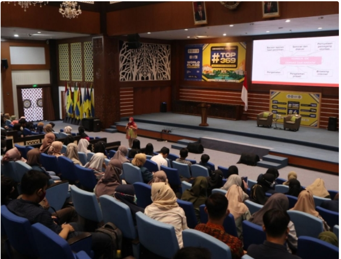
Pemberian tips dan trik sukses skripsi 2022.

SURABAYA – Mahasiswa semester tujuh merupakan mahasiswa semester akhir pada tahun pembelajaran saat ini. Pada masa seperti itulah biasanya mahasiswa semester tujuh kerap sibuk mengerjakan tugas akhir atau skripsi sebelum sampai pada tahap wisuda. Namun, tak jarang terdapat kendala dalam proses pengerjaan skripsi.