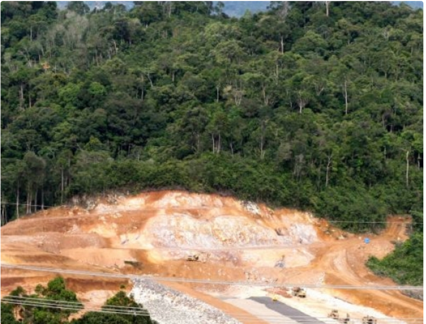
Tambang emas yang beroperasi di hutan Sumatera Utara.

SURABAYA – Ekonom lingkungan Stefan Giljum et al. mengeluarkan penelitian yang berjudul “A Pantropical Assessment of Deforestation Caused by Industrial Mining.” Disitu disimpulkan bahwa Indonesia menempati posisi pertama dalam melakukan deforestasi untuk keperluan industri pertambangan dalam periode 2000-19.